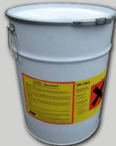
ESTOL - Peinture de plafond