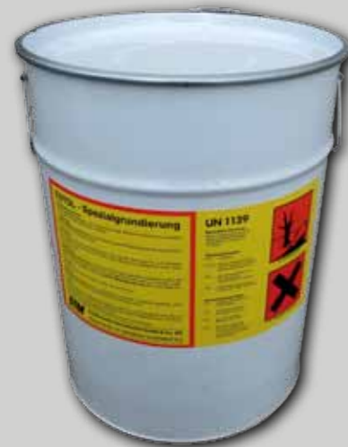
ESTOL - Enduit spécial