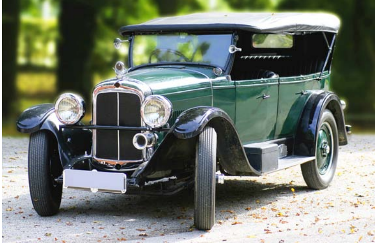
„Oldie-Tour de Ländle“