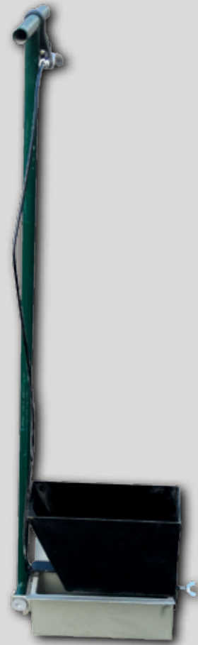
Ziehschuh mit Dosierbehälter